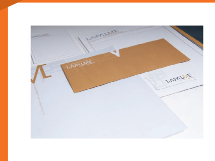
POCHETTES ET PAPETERIE