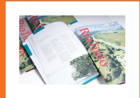
DÉPLIANTS ET BROCHURES